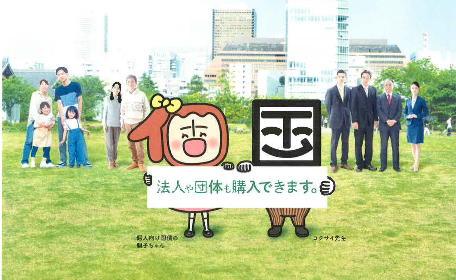
個人向け国債の 個子ちゃん