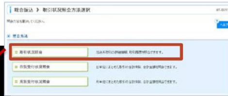
総合振込取引状況照会方法選択画面 (BTJS017)