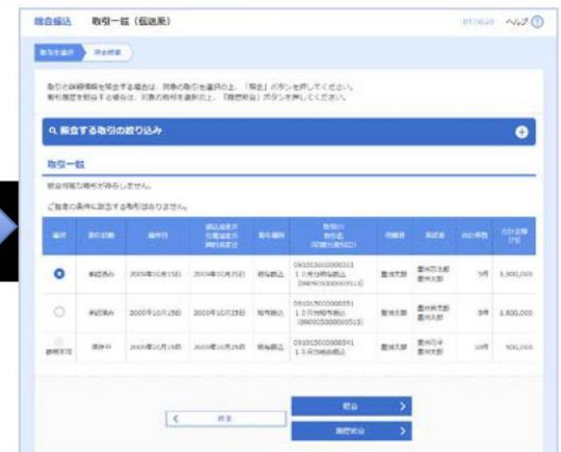
総合振込作業内容選択画面 (BSGF001) 総合振込取引状況照会方法選択画面 (BTJS017) 総合振込取引一覧画面 (BTJS020)