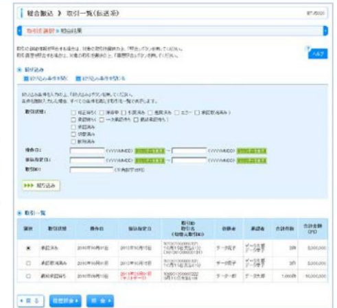
総合振込取引一覧画面 (BTJS020)