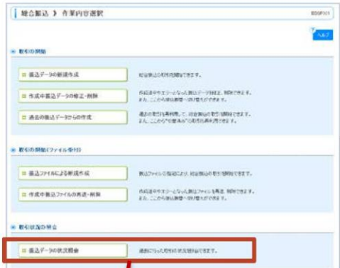
総合振込作業内容選択画面 (BSGF001)